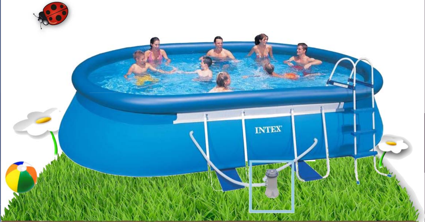
Espace intérieur de nage :