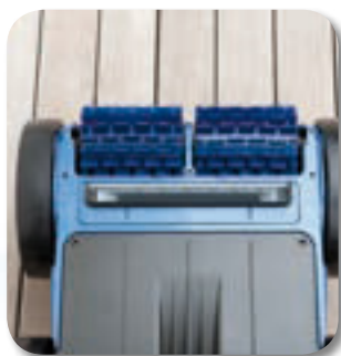
Bouche d'aspiration extra large pour aspirer tous types de débris